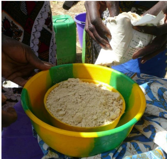
Wardogo Burkina Faso 2014