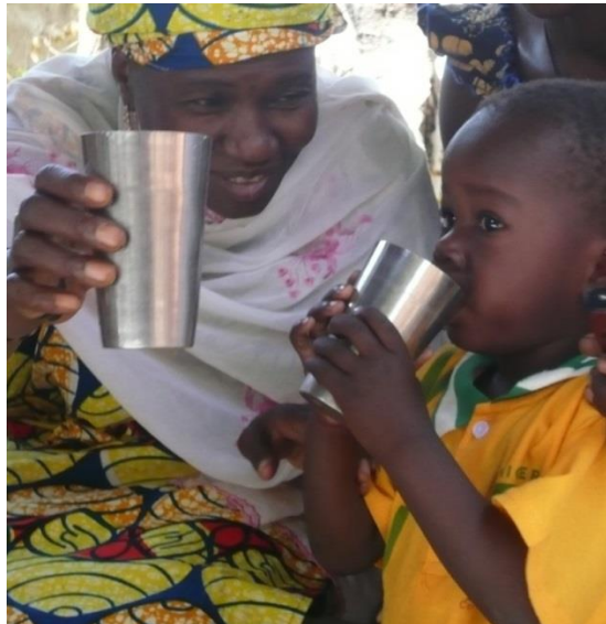
Koupéla Burkina Faso 2014

La bouillie est assez liquide pour être consommée rapidement et complètement