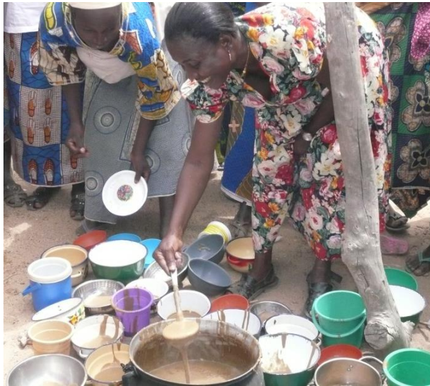
Burkina Faso 2008

Soit dans le bol de chacun des enfants .