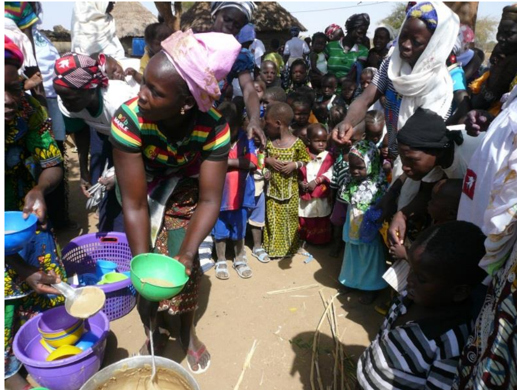
Wardogo Burkina Faso 2014

Distribution de la bouillie dans un lieu communautaire de restauration infantile (Maquis Bébés)