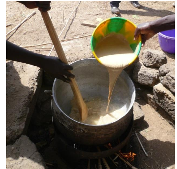
Wardogo Burkina Faso 2014