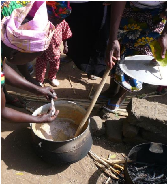
Wardogo Burkina Faso 2014