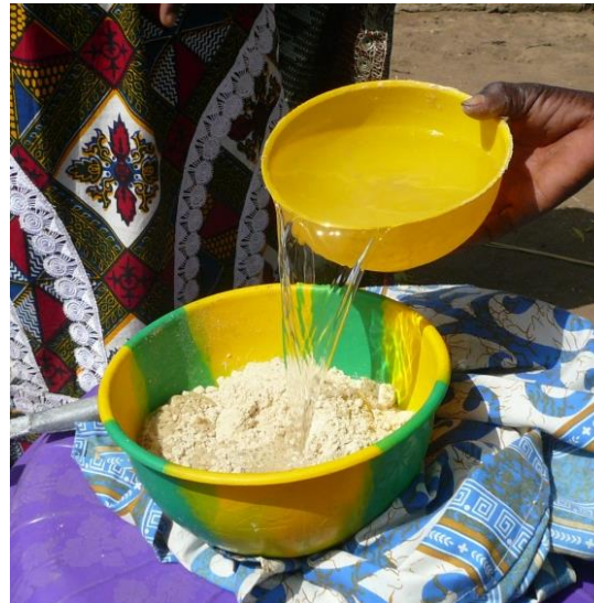
Wardogo Burkina Faso 2014