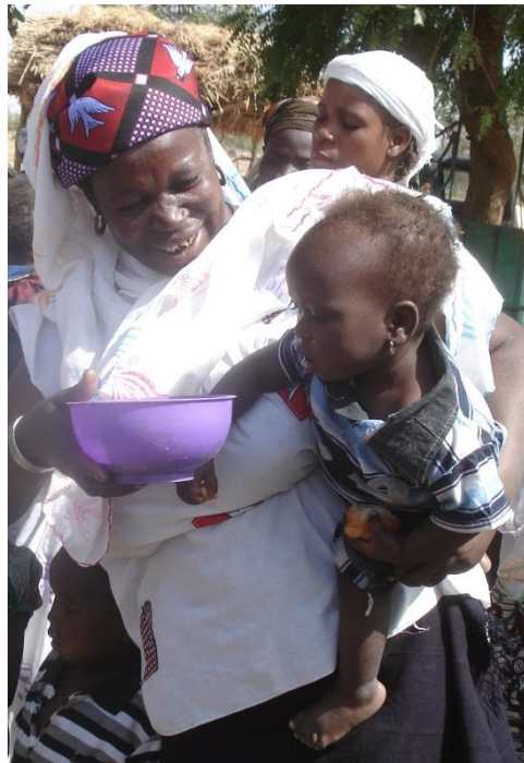
Wardogo Burkina Faso 2014