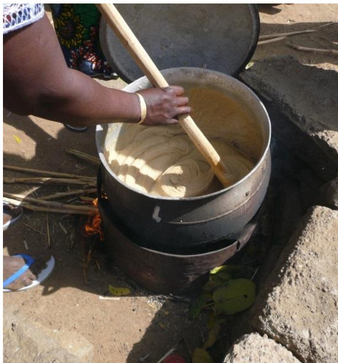
Wardogo Burkina Faso 2014

Faire cuire jusqu'à ce que la bouillie soit bien épaisse.