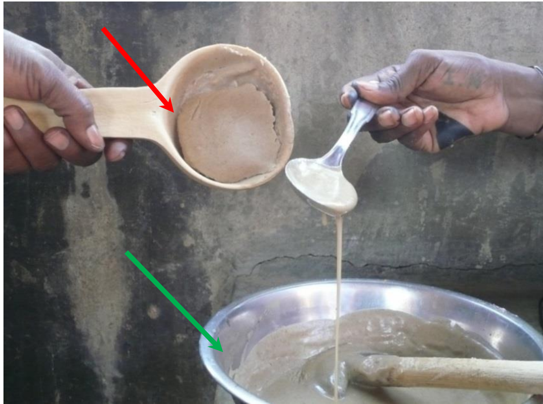
Koupéla Burkina Faso 2014

La bouillie épaisse, avant l'ajout de 3 pincées de malt. La même bouillie, une à deux minutes après l'action du malt.