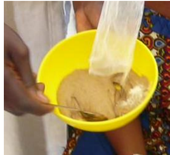
Tambacounda Sénégal 2013

Puis ajouter dans chaque bol, - 3 pincées de malt, - ou bien un peu de lait de la maman, - ou remuer avec la cuillère mouillée de salive de la maman.