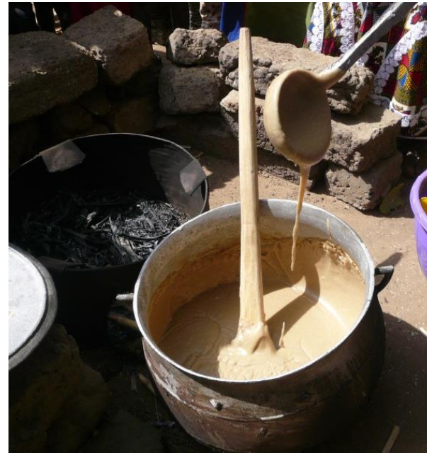
Wardogo Burkina Faso 2014